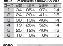
4428 有賀 達也 (A1・埼玉・39歳)