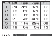
4459 片岡 雅裕 (A1・香川・38歳)