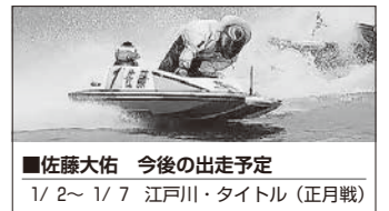
■佐藤大佑 今後の出走予定 1/ 2~ 1/ 7 江戸川・タイトル（正月戦） 1/13~ 1/19 若松・一般競走 1/23~ 1/28 浦和・一般競走