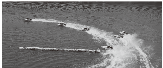
舟券が当たっても当たらなくてもVTRで確認を!

さらに記者の目は各選手の1マークの動向だけでなく、○○は△△よりパワーが上とか、□□は出足甘いいけど伸びは上々といった個々の選手の気配も同時並行に判断し脳へインプットします。これらの情報は探りにいくのではなく、印象に残ったものだけを脳が自動的に記憶するので、このような技を一般ファンが習得するのはたいへんですが、「自動的に記憶」という部分を「出走表にメモする」に代えて習慣づけることはできると思います。これがセンスを磨くコツです。