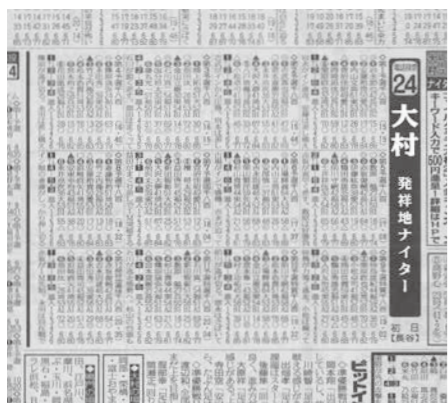
フォーカス出しは難しい。悩みつつも、慎重かつ大胆に紙面へアップ

の順。フォーカス（買い目）は◎ー○▲△ー○▲△、○ー◎ー▲△の計8点が自動的に掲載される。大村でビット解説をさせてもらう時、一番悩むのはフォーカスの出し方だ。新聞どおりの買い目なら8点。狙い目もあればさらに増える。また、事前収録の展望番組では出していたフォーカスを、展示を見て消したら当たっていたということもあった。そんな時は落ち込んで引きずってしまう。人間だもの。