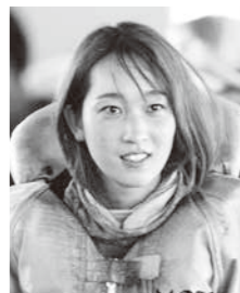
惜しくもPGIスピードクイーンメモリアル第1回大会出場は逃したが、選考期間内最後の開催でのタイムアタックで魅せた高憧

4日目9Rのイン戦を逃げ切り、最終日8Rではコンマ02の鋭いスタートを決めて4コースから差し切り勝ち。抜群の勝負度胸、根性を見せた。3周ひたすら「良いタイムが出てくれ」とそれぞれが見守ったが、タイム更新はかなわなかった。記録には残らなくても、記憶として強く残ったタイムアタック。第1回大会の出場は逃した（予備8位）が、次は必ず出場してほしいと願っている。 ■